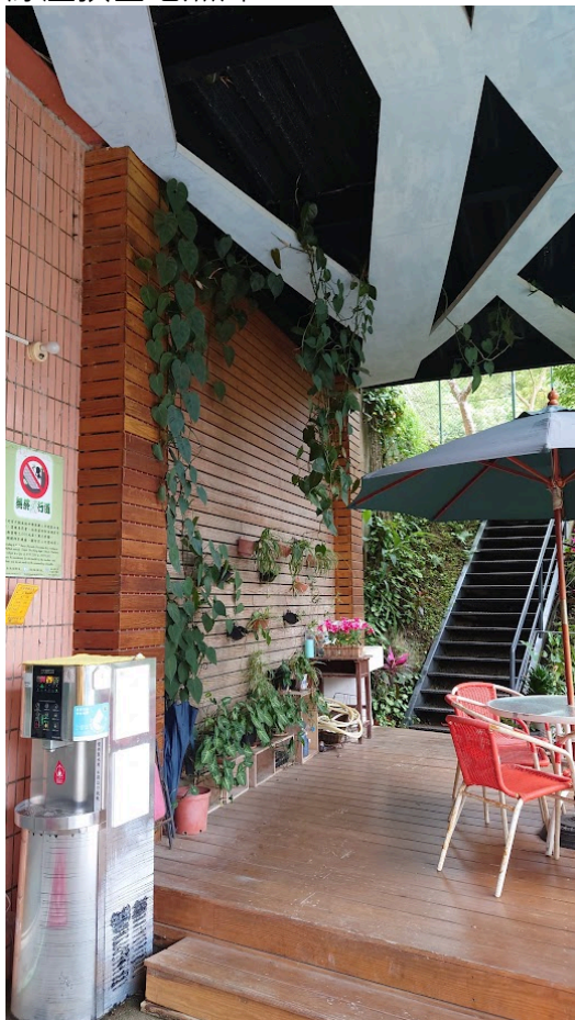
綠屋頂基地照片說明2 校門左側涼亭休閒座椅區旁邊自然生長之攀爬 綠牆與小盆栽