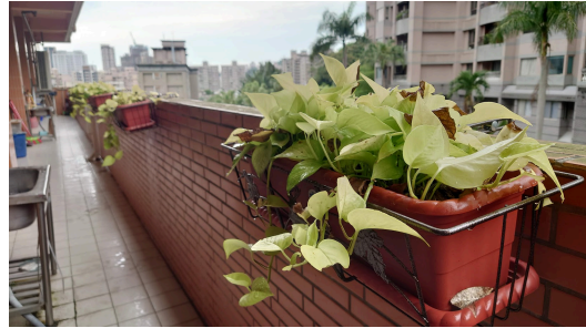
綠屋頂基地照片說明8 西側教室7F後陽台與隔壁社區大王椰子樹呼應