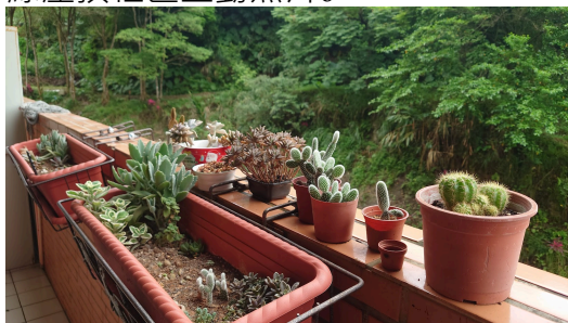
綠屋頂社區互動照片說明6 大樓東側7F教室後陽台，學生自己栽種了多肉植物及仙人掌。