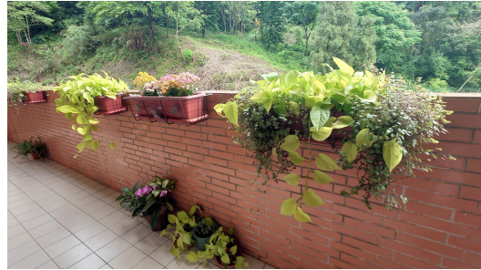
綠屋頂社區互動照片說明4 大樓東側5F輔導室後陽台植栽與後山山景