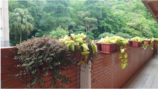
綠屋頂社區互動照片說明2 大樓西側7F教室後陽台植栽與隔壁社區後山相 呼應