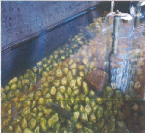
說明：本校魚菜共生系統 十、特色: