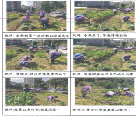
說明：第 2 次社團活動-除草整地