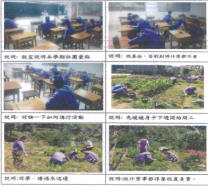
說明：第 1 次社團活動-課程說明及除草