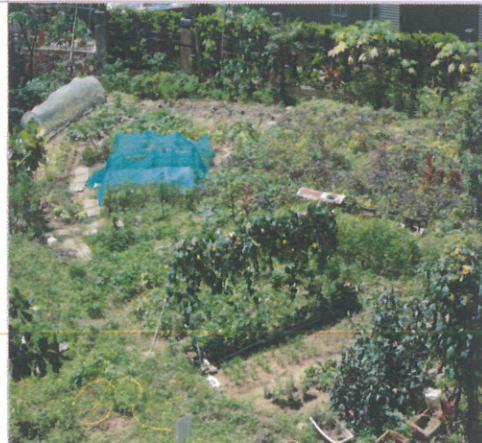
說明：本校小田園全景