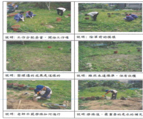
說明：第 4 次社團活動-整理另一塊基地及移株示範