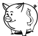
原私校退撫基金(舊制) 111年度1月至12月期間收益率

3. 資料來源：財團法人中華民國私立學校教職員退休撫卹離職資遣儲金管理委員會網站公告資料。